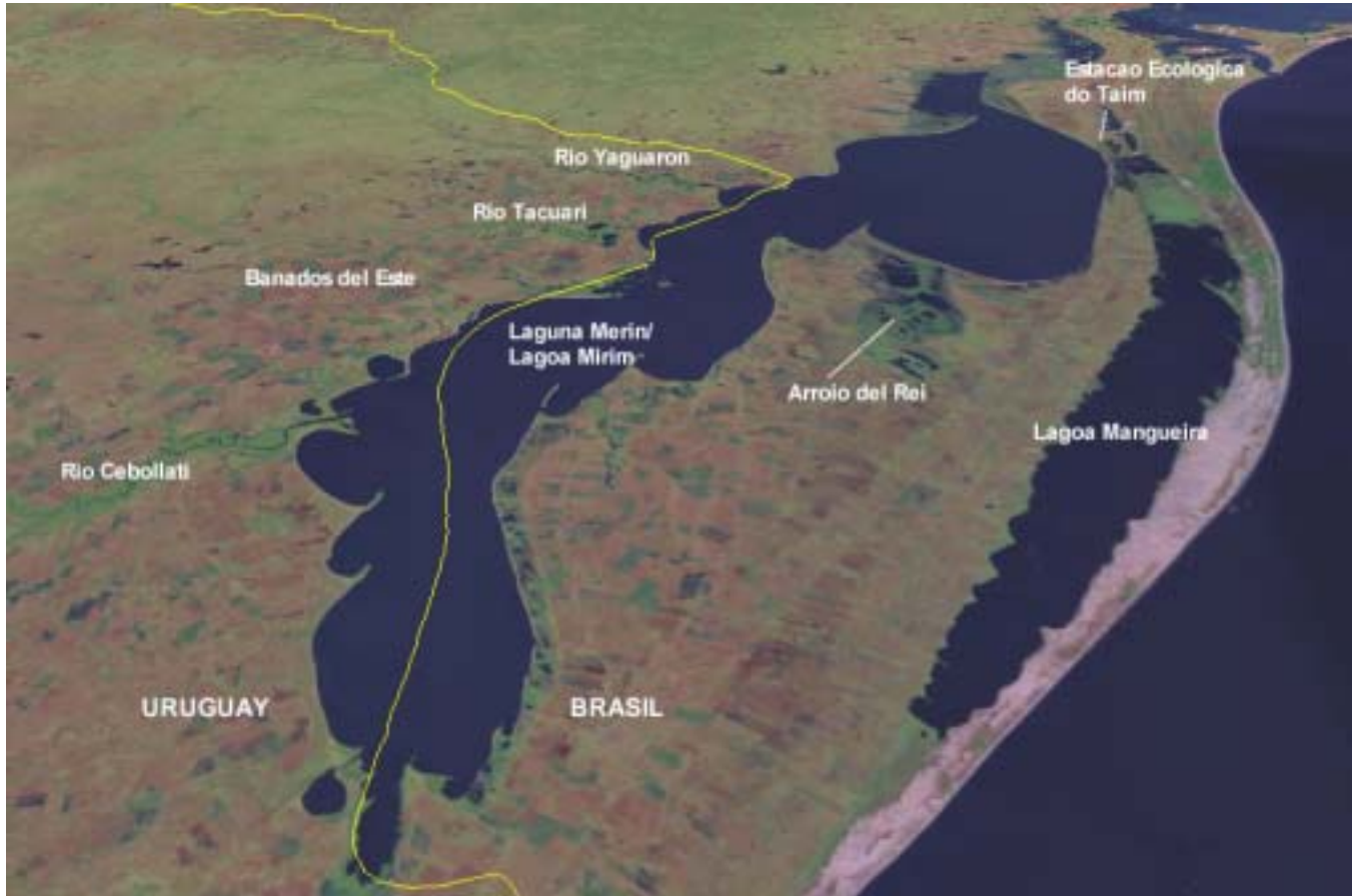
Nesta imagem oblíqua, olhando da parte sul da Lagoa Mirim em direção ao norte, a localização da fronteira Brasil-Uruguai é aproximada; ela está a cerca de um quilometro acima da imagem. Esta imagem foi obtida através do instrumento de visualização de dados da NASA, WorldWind.

A Lagoa Mirim (Laguna Merin em Espanhol) é um grande lago localizado na fronteira entre o Brasil e o Uruguai. É o segundo maior lago da América do Sul depois do Lago Titicaca nos Andes. A Lagoa e o complexo de áreas úmidas ao seu redor abrigam uma variedade de aves aquáticas, assim como outros tipos de fauna e flora de importância internacional.